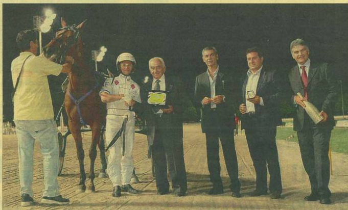
La premiazione del Premio Orogel 2010