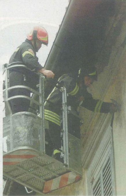
RILIEVI I muri hanno tremato a Meldola, l'epicentro del sisma, e a Bertinoro e Forlimpopoli

L'ULTIMO grande sussulto a Forlì è delle 22.22 del 5 aprile 2009, che prelude al disastro in Abruzzo. Magnitudo 4.6, Forlimpopoli il focolaio. Il più grave degli ultimi anni è del 26 gennaio 2003, magnitudo 4.2, origine Santa Sofia. Dove diverse case risultano danneggiate; decine di persone restano sfollate per giorni. Nel 2000 Forlì è martoriata da uno sciame di due mesi: terrore a distesa, pochi danni.