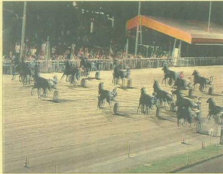
La partenza ai nastri della Corsa Tris di venerdì, uno degli appuntamenti più attesi della serata